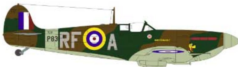
Mk IIb, 303 Sqdn RAF, England 1941. Mk IIb, 303 Dywizjon RAF, Anglia 1941r.