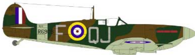
Mk Ib, 92 "East India" Sqdn RAF, Manston, England, December 1940. Mk Ib, 92 Dywizjon RAF, Manston, Anglia, grudzień 1940r.