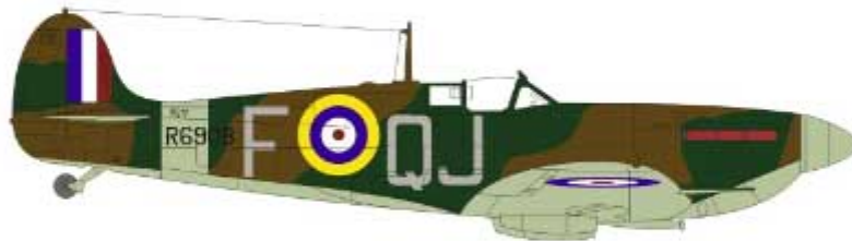
Mk Ib, 92 "East India" Sqdn RAF, Manston, England, December 1940. Mk Ib, 92 Dywizjon RAF, Manston, Anglia, grudzień 1940r.