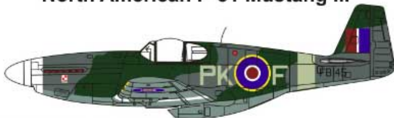
PK-F FB145, 315 Dywizjon RAF, wiosna 1944. PK-F FB145, 315 Sqdn RAF, Spring 1944.