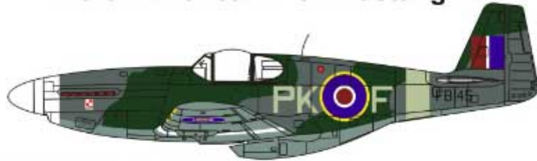
PK-F FB145, 315 Dywizjon RAF, wiosna 1944. PK-F FB145, 315 Sqdn RAF, Spring 1944.