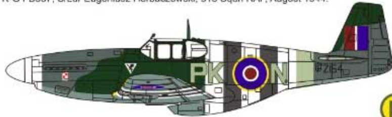
PK-N FZ154, 315 Dywizjon RAF, czerwiec 1944. PK-N FZ-154, 315 Sqdn RAF, June 1944.