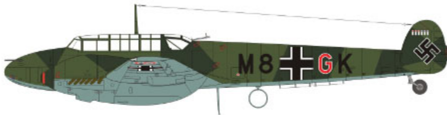
M8+GK of Hauptmann Wolfgang Falck, Staffelkapitan 2./ZG 76, Jever, December 1939. M8+GK, Hauptmann Wolfgang Falck Staffelkapitan 2./ZG 76, Jever, grudzień 1939.