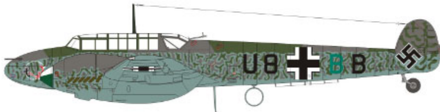
U8+BB of Hauptmann Gunther Sprecht, Gruppenadjutant, I./ZG 26, France, May 1940. U8+BB, Huupmann Gunther Sprecht, Gruppenadjutant, I./ZG 26, Francja, maj 1940.