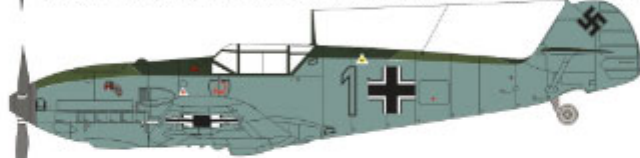
1/JG2 Spring 1940 1/JG2 Wiosna 1940