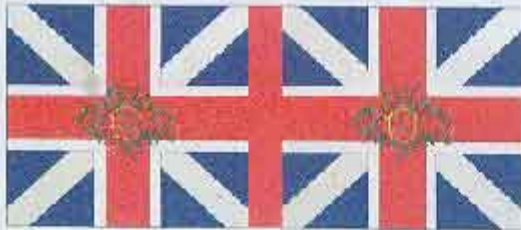
33th Foot, Regimentsfahne und Königsfahne Ab Mai 1775 mit Cornwallis in Amerika, Charleston 1776, New York 1777, Virginia und Carolinas-Feldzüge, 1781 Yorktown.