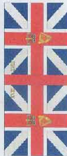
Königsfahne und Regimentsfahne 18th Foot (Royal Irish Regiment) Boston 1774, May 1781, New Jersey Feldzug 1776/77, Germantown, Sandy Point 1778, Yorktown 1781