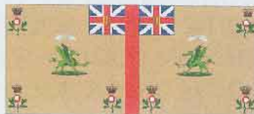
Königsfahne und Regimentsfahne 3rd Foot (The Buffs) In Amerika Juni-Sept. 1781, Eutaw Springs, Carolinas 1781.

Rofur Flags © Rolf Fuhrmann 2003 www.Rofur-Flags.de