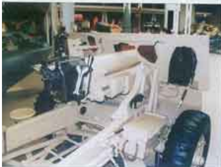
▲ To samo działo; w dużej sakwie na wewnętrznej stronie tarczy ochronnej przewożono w czasie marszu celownik artyleryjski.