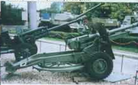
▲ Armato-haubica 25pdr C Mk.II na ławecie C Mk.I, produkcji kanadyjskiej z 1943 r., z kolekcji Muzeum Wojska Polskiego. Działo w położeniu marszowym; przed obsadą zamka na płaszczu lufy widać dodatkowe obciążenie masowe, standardowe wyposażenie wszystkich dział z hamulcem wylotowym służące właściwemu wyważeniu działa.