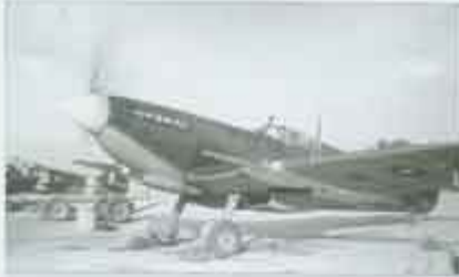
W kabinecie sześciodzielnego Spitfire „biała 77” z numerem „385” widoczna na drugim planie; Peshawar, listopad 1945 r.