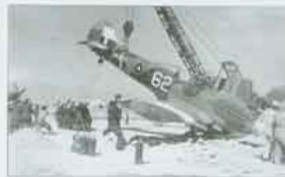
Zdjęcie „białej 62” po niezły udarowym lądowaniu, w trakcie przywracania do horyzontalnej pozycji; Peshawar, luty 1946 r.