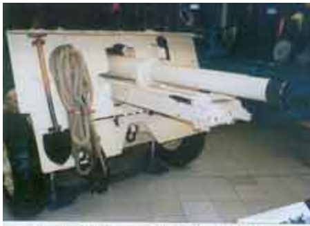
▲ Armato-haubica 25pdr Mk.II na ławecie Mk.I zachowana w Imperial War Museum w Londynie. Działo to służyło w brytyjskim 11. pułku artylerii polowej w Afryce i wzięło udział w bitwie na Ruweisat Ridge 2 lipca 1942r., odpierając natarcie sił Rommela. W czasie tej akcji pułk poniósł straty sięgające prawie 25%. Na tarczy ochronnej działa widać przepisowo założone wyposażenie, łopate, liny holownicze, tyczki kierunkowe.