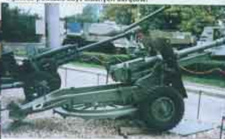
▲ Armato-haubica 25pdr C Mk.II na ławecie C Mk.I, produkcji kanadyjskiej z 1943 r., z kolekcji Muzeum Wojska Polskiego. Działo w położeniu marszowym; przed obładą zamka na płaszczu lufy widać dodatkowe obciążenie masowe, standardowe wyposażenie wszystkich dział z hamulcem wylotowym służące właściwemu wyważeniu działa.