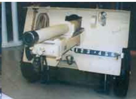
▲ To samo działo; w wycięciu tarczy ochronnej działa widać obiektyw celownika teleskopowego, a ponad krawędzią złożonej górnej części tarczy obiektyw celownika artyleryjskiego. Uchwyt holowniczy widoczny poniżej lufy w wycięciu tarczy ochronnej służy do wciągania działa na platformę ogniową.