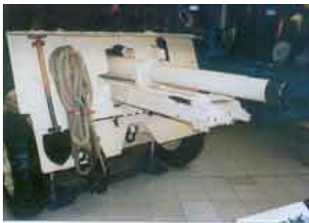
▲ Armato-haubica 25pdr Mk.II na ławecie Mk.I zachowana w Imperial War Museum w Londynie. Działo to służyło w brytyjskim 11. pułku artylerii polowej w Afryce i wzięło udział w bitwie na Ruweisat Ridge 2 lipca 1942r., odpierając natarcie sił Rommela. W czasie tej akcji pułk poniósł straty sięgające prawie 25%. Na tarczy ochronnej działa widać przepisowo założone wyposażenie, łopate, liny holownicze, tyczki kierunkowe.