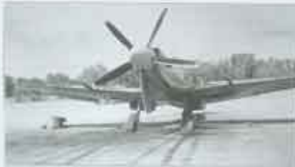
Zdjęcie prawdopodobnie dwóch różnych Spitfire z pięciopłatowym śmigłem, na skrzydle niezidentyfikowany mechanik lub pilot; Peshawar, grudzień 1945 r.