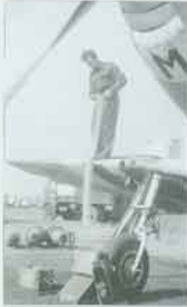
Mechanicy uzupelniają amunicję w Mustangu FX385 PK-M, przygotowując go do następnego lotu. W tle widać Mustanga FX385 PK-X.