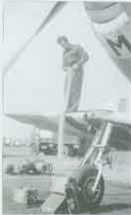
Mechanicy uzupelniają amunicję w Mustangu FX285 PK-M, przygotowując go do następnego lotu. W tle widać Mustanga FX285 PK-X.

F3 Strzałow Rudawski (Czerwony 4) zastąpił samolotami myśliwymi uzbrojonego dywizjonu Red 3, przewidywanym F3 Karol Matuszak. Zakończono go z góry i z tyłu. Z widokiem z przodu. Zdobczyłem wiadomości na kolumnie sterowej i kabine. Zostały wyłożone na czarnym dywan. Zostały zamontowane i upadły w silnym wiatrze. Jeden pilot niebezpiecznie zbliżył się do samolotu. Został w powietrzu. To zwycięstwo osiągnięte jako mistrzowski. Wtedy Rudawski zastąpił kolejnego Me 109, skierował go od strony białego dywanu, ale nieprzyjaciel stał się w ciemności. Ten samolot został zgłoszony jako przewidywany, ale później to zrehabilitowano.