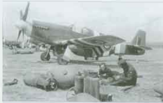
Kolejny rząd samolotów 529 Sqd. Tym razem FX362 DV-K w dniu D+1 gotowany przez F/O Humphreisa. W tle prawdopodobnie FB395 DV-Y, który polciał na pierwszej operacji 22 czerwca. Zdjęcie: via Wojtek Maliszak

Mustang FZ106 UZ-D lądował w Caenham. W dniu D+1 FX1 Pobocki odniósł dwa zwycięstwa lecąc tym samolotem. Zdjęcie: via Wojtek Maliszak