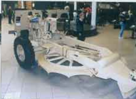
▲ To samo działo; na wewnętrznej stronie prawego ramienia skrzyniowego ogona widać stempel w uchwytach transportowych. Dobrze widoczne jest też siodełko celownicze. Charakterystyczne wystające na hoki uszy w tylnej części ogona amortyzowały ewentualne uderzenia o jaszcz podczas zbyt ciasnych skrętów.