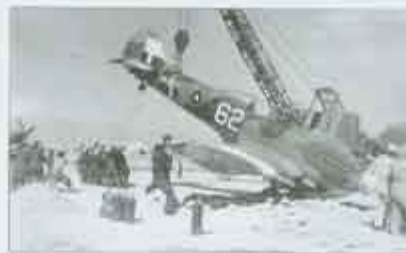
Zdjęcie „białej 62” po niezłym udarowym lądowaniu, w trakcie przywracania do horyzontalnej pozycji; Peshawar, luty 1946 r.