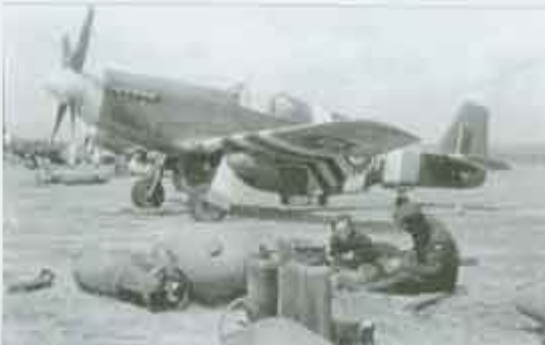
Kolejny rząd samolotów 529 Sqn. Tym razem FX362 DV-K w druku D+1 gotowany przez F3O Humphreisa. W tle przewidywanym FB395 DV-Y, który poleciał na pierwszą operację 22 czerwca.