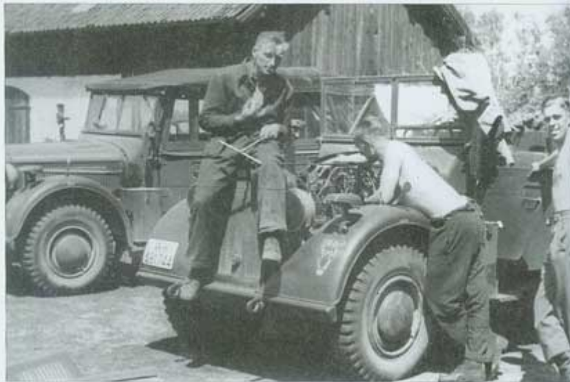
The maintenance section maintains a Horch (Kfz. 15) of the Headquarters Battery. • Wartungsarbeiten des I-Trupps an den Horch (Kfz. 15) der Stabsbatterie.