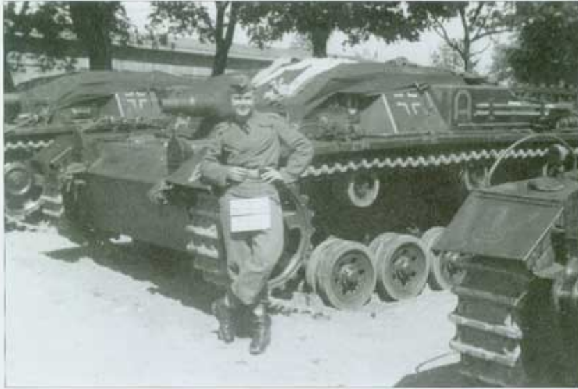
A great deal of emphasis was placed on maintaining the assault guns, and the members of the batteries became intimately familiar with the guns—inside and out. The tactical markings of the guns can be seen to good advantage on the left mudguards of the vehicles. • Größte Sorgfalt wird auf die Pflege und Wartung der Sturmgeschütze gelegt und die Batterieangehörigen lernen die Geschütze in- und auswendig kennen. Auf den linken Kettenabdeckungen der Geschütze ist das taktische Zeichen der Sturmartillerie gut zu erkennen. [Kröber/Haley]