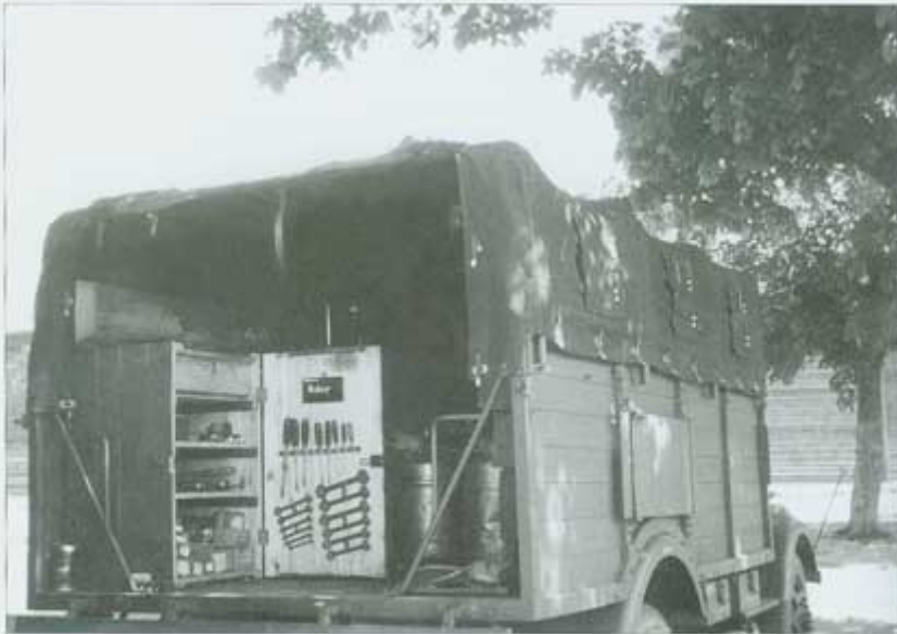
A look inside the equipment truck of the armaments section of the battalion. • Blick in den Gerätewagen der Waffenmeisterei der Abteilung. [Tabellion]