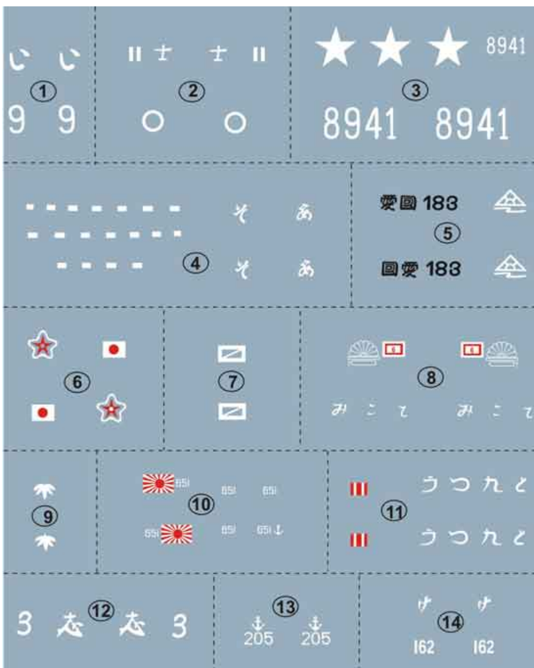
Armo 72425 Japońska broń pancerna cz. 2 Japanese Armor part 2