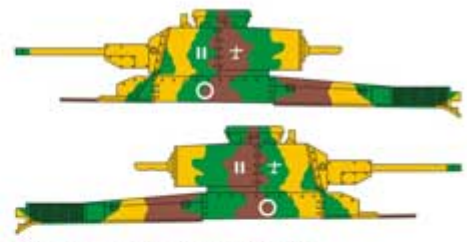
② Typ 97 Shinhoto Chi-Ha, 11 Pułk Pancerny, Wyspy Kurylskie, 1945. Type 97 Shinhoto Chi-Ha, 11th Tank Regiment, Kurile Islands, 1945.