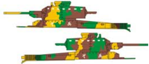
④ Typ 97 Shinhoto Chi-Ha, 9 Pułk Pancerny, Sajpan, czerwiec 1944. Type 97 Shinhoto Chi-Ha, 9th Tank Regiment, Saipan, June 1944.