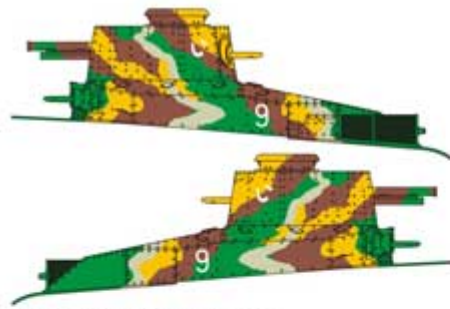
① Typ 89 (2594) Jednostka nieznana, Szanghaj, Chiny, 1937. Type 89 (2594) Unit unknown, Shanghai, China, 1937.