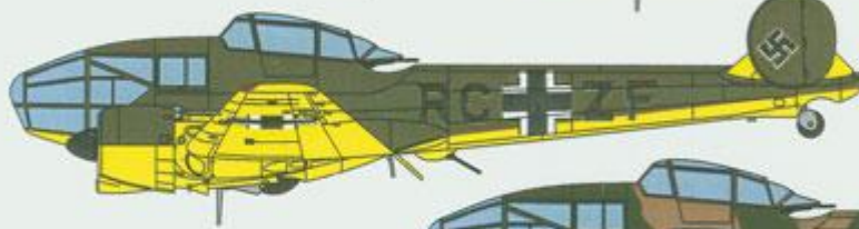
Potez 63-11, RC+ZF.