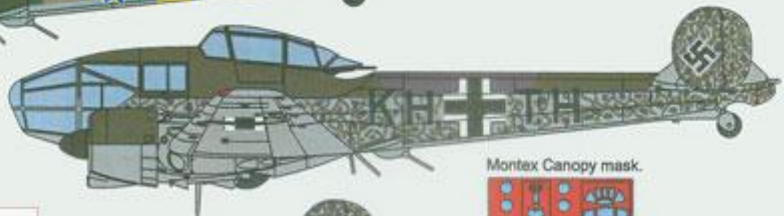
Hungarian Potez 63-11 ,KH+TH in German marking, Aviation Research Institute, Topoca airfield, summer 1944.