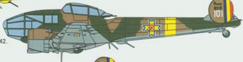
Potez 63-11, 101, Roumanian Air Force, 1942.