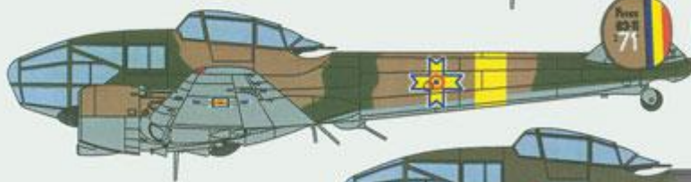
Potez 63-11, 71, Roumanian Air Force, 1942.