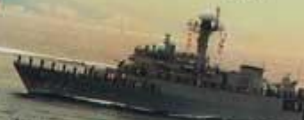
korwaty typu „Pohang”

Magazyn miłośników spraw wojennomorskich