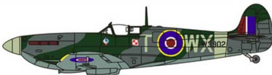
WX-T W3902, 302 Sqn RAF, February 1943. WX-T W3902, 302 Dywizjon RAF, luty 1943.