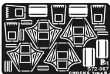
Photo-etched parts can only be glued with cyanoacrylate glue. Work in a well ventilated area. Do not inhale vapors since these can be harmful. Wash your hands after using.