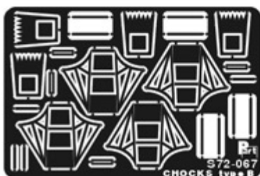
Photo-etched parts can only be glued with cyanoacrylate glue. Work in a well ventilated area. Do not inhale vapors since these can be harmful. Wash your hands after using.