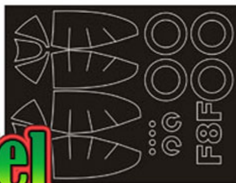
Masks for outside of the canopy