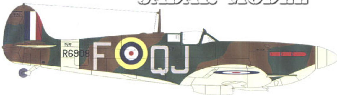
Mk IIb, 92 "East India" Sqn RAF, Manston, England, December 1940. Mk IIb, 92 Dywizjon RAF, Manston, Anglia, grudzień 1940r.