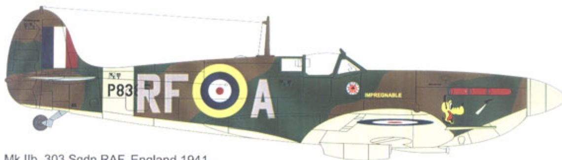
Mk IIb, 303 Sqn RAF, England 1941. Mk IIb, 303 Dywizjon RAF, Anglia 1941r.