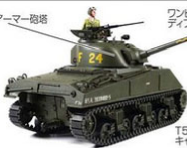
ワンピース ディファレンシャルカバー