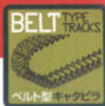
■キャタピラは組立て時のベルト型