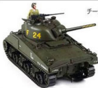
チークアーマー砲塔