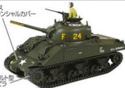
T51ベルト型 キャタピラ

M4シャーマンは、溶接車体にR975空冷航空機用星形エンジンを搭載した戦車で、4つの工場で作られた。1943年から1944年の間、5072台と、ほとんどのドライバーズハッチが小さなタイプの仕様で約5072車両が製造されました。その車両は、北アフリカ、北西ヨーロッパでの戦い、太平洋戦争まで、アメリカ陸軍の戦力として参戦しました。M4シャーマンは長い生産期間で、様々な改良がされ、数多くのタイプがあります。本キットは、1943年後期にプルマンスタンダード社で製造されたM4シャーマン後期型をモデル化しています。溶接車体にワンピースディファレンシャル