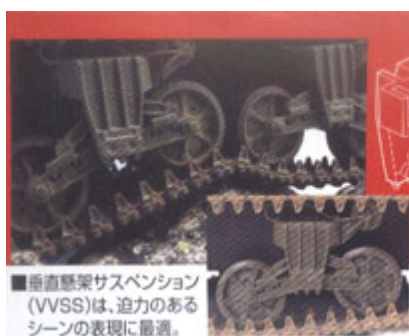
■垂直懸架サスペンション (VVSS)は、迫力のあるシーンの表現に最適。

（模型要目）…キャタピラはT51ベルト型キャタピラ。デカールはノルマンディー戦に参戦した「FAY」のマーキングです。