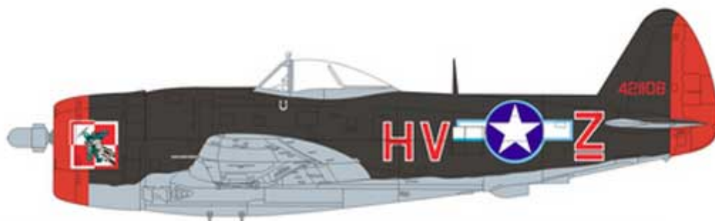
P-47M-RE 4421108, Capt. Witold Łanowski, 61 FS, 56 FG, 8 AF, Boxted, England, April, 1945. P-47M-RE 4421108, Capt. Witold Łanowski, 61 FS, 56 FG, 8 AF, Boxted, Anglia, kwiecień 1945.