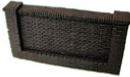
HTK-A147 Chocolate Brown