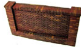
HTK-A133 Signal Orange