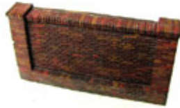
HTK-W001 Light Grey