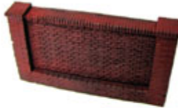
HTK-A131 Brown Red