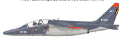
Dassault/Dornier Alpha Jet 18, AT-25, Advanced Jet Training School (A.J.T.S.), Bretteville, France