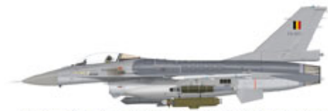
Lockheed Martin F-16AM, FA-103, N°349 Squadron, fitted with a Sniper Pod, ALQ-131 and GBU-38

Standard colours of Belgian aircraft since 1990s