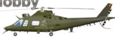
Agusta A109BA (Belgian version of A109C with fixed landing gear), H-37, anti-tank variant, 2008

Since the withdrawal from operations of many aircraft types after the end of the cold war (in early 1990s), the Belgian AF (renamed Air Component of the Belgian Armed Forces in 2002) has used limited number of colours. F-16AM/BM fleet wears the standard three-colour F-16 scheme of FS36270, FS36078 and FS36375. The latter two colours are also used on current camouflage scheme of Alpha Jets (since 2005 detached to the 'Advanced Jet Training School' at Coesmes, France). Westland Sea King Mk.48s (SAR variants) wear a unique scheme of BS Olive Green and BS Light Stone wrap-around, while the most modern helicopters feature FS34079 Dark Green for army use (A109BA, NH90 TTH) or FS26440 Light Gull Grey for navy use (NH90 MTH).