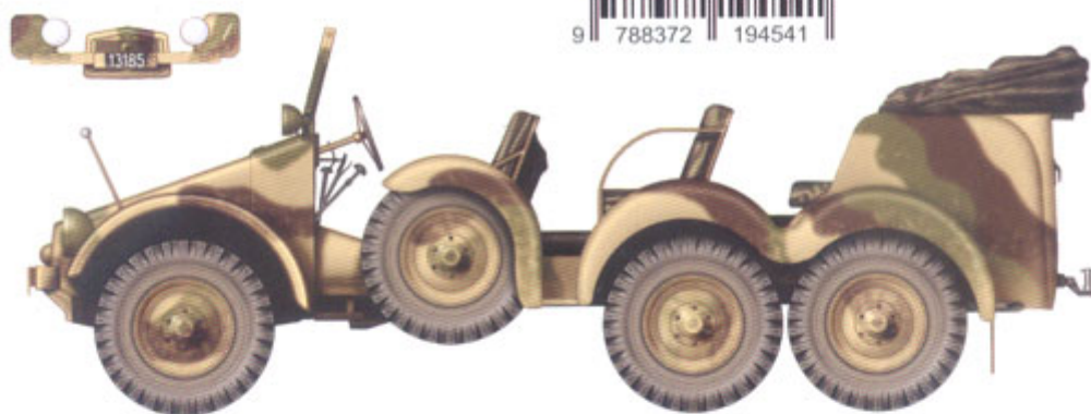
Krupp L 2 H 143 (6x4) ze szwadronu strzelców dywizjonu rozpoznawczego 10. brygady kawalerii, manewry wołyńskie, wrzesień 1938 roku. Polish Krupp L 2 H 143 (6x4) staff car from the rifle squadron Reconnaissance Battalion 10th Cavalry Brigade, Volhynian Manoeuvres in September 1938.