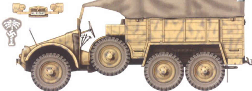
Krupp L 2 H 143 (6x4) Kfz 81 z nieustalonej jednostki artylerii przeciwlotniczej Luftwaffe, Libia, kwiecień 1942 roku. Krupp L 2 H 143 (6x4) Kfz 81 tractor from unidentified Luftwaffe AA unit, Libya in April 1942.