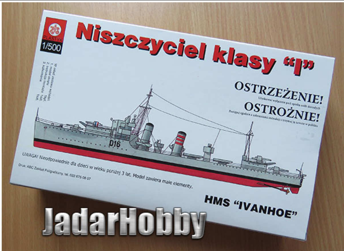
Jadar-Model Warszawa. Raj dla modelarzy