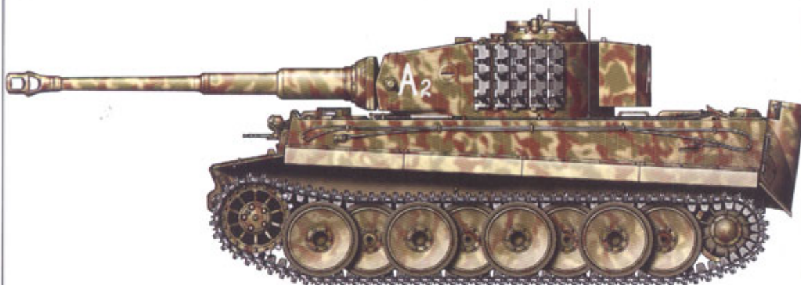
Panzerbefehlswagen VI „Tiger” Ausf. E Sd Kfz 267 z dowództwa 508. Batalionu Czołgów Ciężkich, Włochy, sierpień 1944 roku. Panzerbefehlswagen VI "Tiger" Ausf. E Sd Kfz 267 from the HQ of the 508th schwere Heeres Panzer Abteilung, Italy in August 1944.