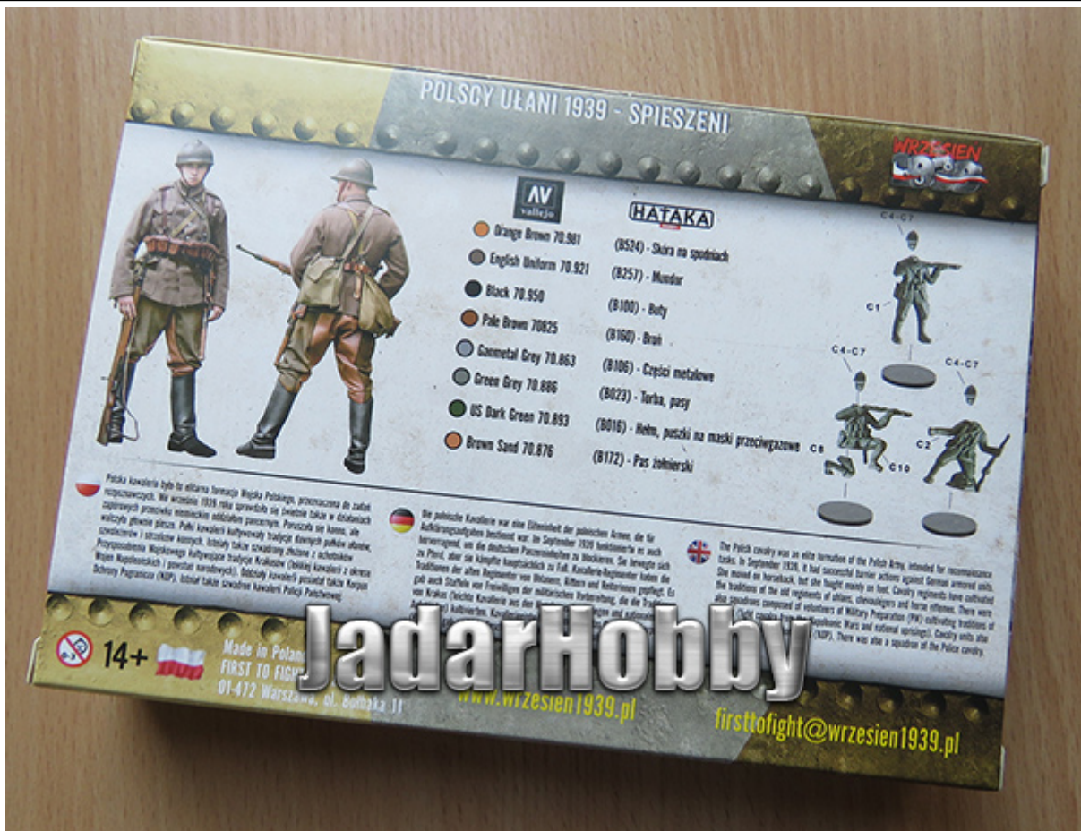
Jadar-Model Warszawa... #Salon Modelarski - Raj dla modelarzy