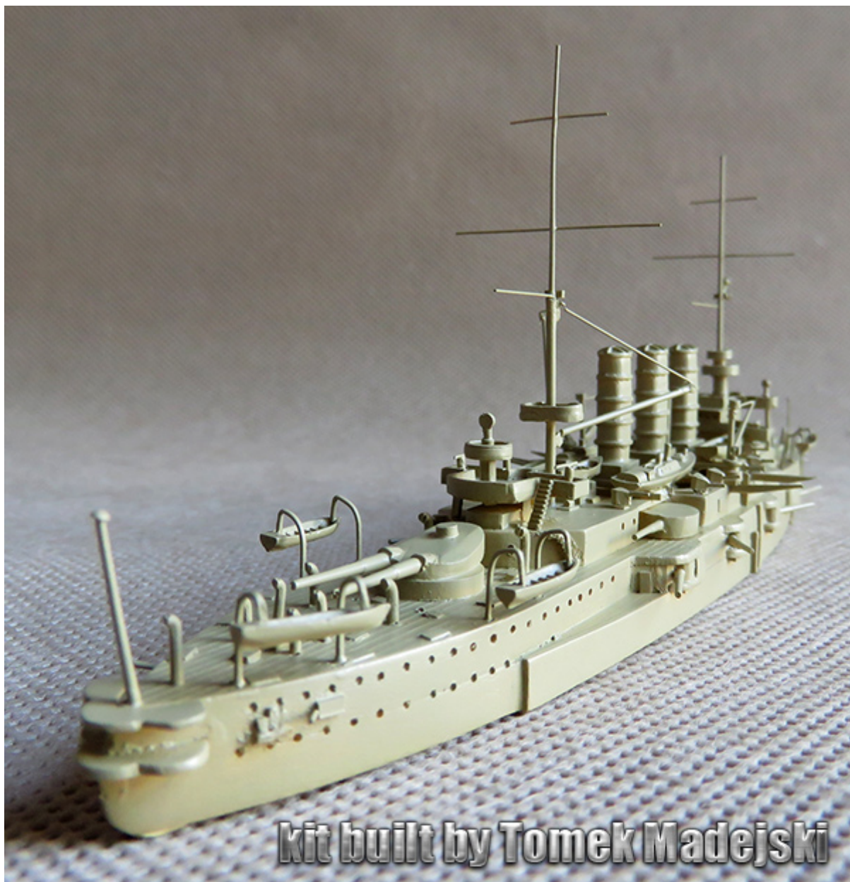
kit built by Tomek Madejski