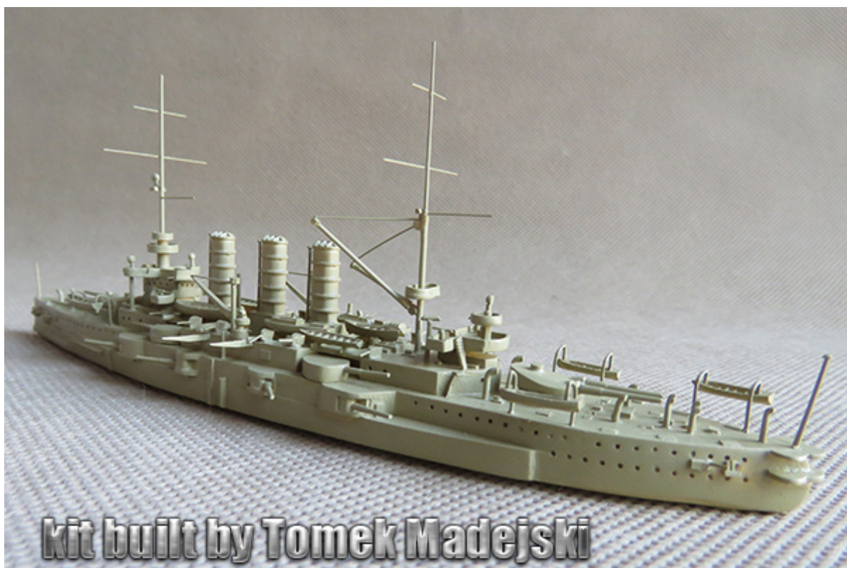
kit built by Tomek Madejski