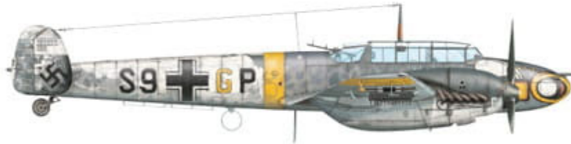
Messerschmitt Bf 110 E-2 trop, WNr. 4018, coded S9+GP, flown by Oblt. Günther Tonne, Kapitän of 6./SKG 210, Orel, USSR, December 1941.