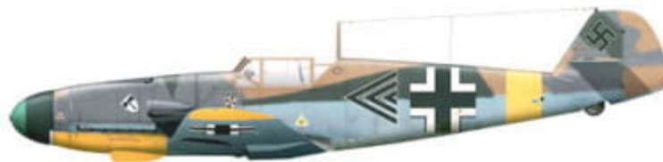
Messerschmitt Bf 109 F-4 trop, WNr. 10098 (probable), flown by Obstlt. Günther Lützw, Kommodore of JG 3, southern sector of the Eastern front, USSR, May 1942.