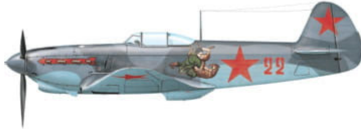
Yakovlev Yak-1b, coded 'Red 22' of 562nd IAP / 318th IAD PVO, Moscow area, USSR, 1943.