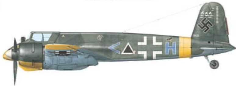
Henschel Hs 129 B-2, W.Nr. 140405, coded \triangleleft + H of 4.(Pz)/Sch.G. 1, USSR, summer 1943.