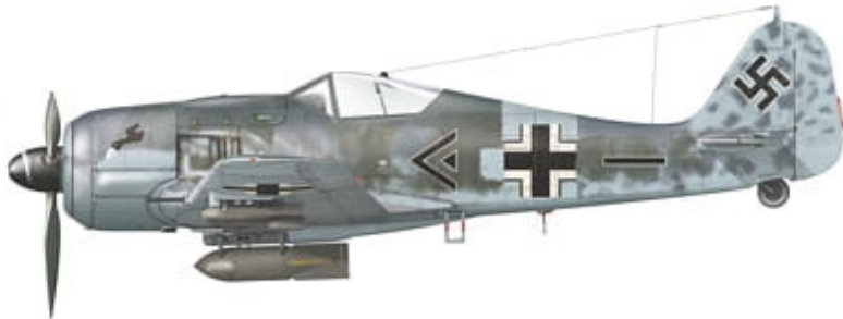
Focke-Wulf Fw 190 F-8, coded Winkel Dreieck, flown by Maj. Theodor Nordmann, Kommandeur of II./SG 3, Riga-Spilve, Latvia, August 1944.