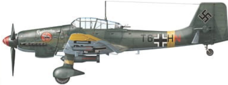
Junkers Ju 87 D-3, W.Nr. 100082 (Stkz. BP+DD), coded T6+HN of 5./StG. 2, Achtirskaaya, USSR, early summer 1942.