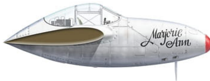
P-38F-1-LO, s/n 41-7578, 'Marjorie Ann', possibly flown by Maj. Richard Ira 'Dick' Bong during his war bond tours, USA, late summer 1944.