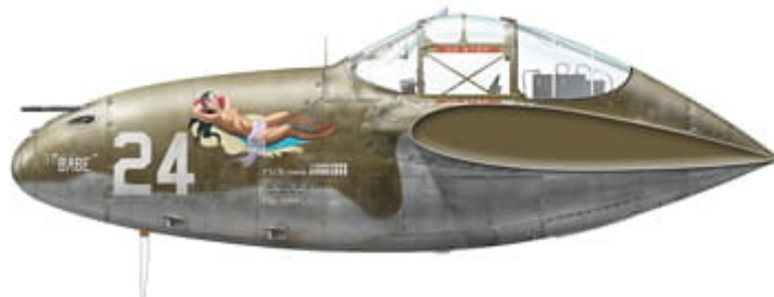
P-38G-15-LO, s/n 43-2475, 'Babe', flown by Lt. Edgar L. Yarberry of 48th FS / 14th FG, El Bathan, Tunisia, second half of June 1943.

This set contains three high quality posters with colour profiles and decal placement guide, and waterslide decals printed by Cartograf.