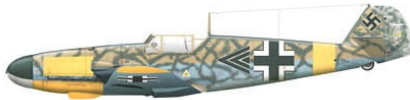
Messerschmitt Bf 109 F-4 trop, WNr. 10266, flown by Maj. Gordon Gollob, Kommodore of JG 77, Oktoberfeld, Crimea, Soviet Union, between June 2 and 6, 1942.