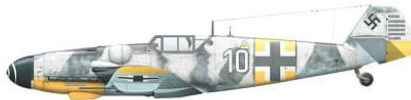
Messerschmitt Bf 109 G-6, 'White 10', flown by Oblt. Robert 'Bazi' Weiß, Kapitän of 10./JG 54, northern sector of the Eastern front, USSR, January 1944.