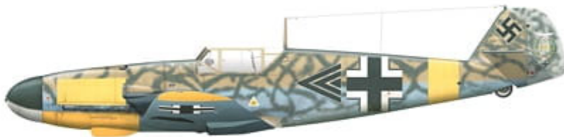
Messerschmitt Bf 109 F-4 trop, WNr. 10266, flown by Maj. Gordon Gollob, Kommodore of JG 77, Oktoberfeld, Crimea, Soviet Union, between June 2 and 6, 1942.