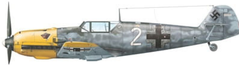
Messerschmitt Bf 109 E-7, 'White 2', flown by Lt. Heinrich Ehrler of 4./JG 5, Alakurtti, Finland, late April 1942.