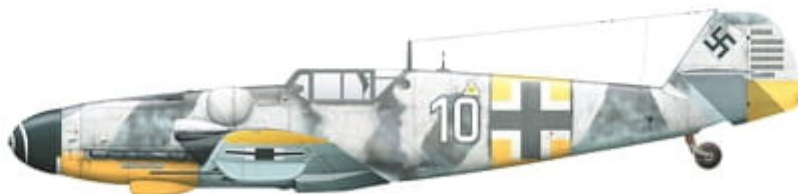
Messerschmitt Bf 109 G-6, 'White 10', flown by Oblt. Robert 'Bazi' Weiß, Kapitän of 10./JG 54, northern sector of the Eastern front, USSR, January 1944.

This set contains three high quality posters with colour profiles and decal placement guide, and waterslide decals printed by Cartograf.