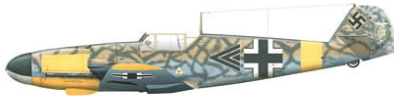
Messerschmitt Bf 109 F-4 trop, WNr. 10266, flown by Maj. Gordon Gollob, Kommodore of JG 77, Oktoberfeld, Crimea, Soviet Union, between June 2 and 6, 1942.