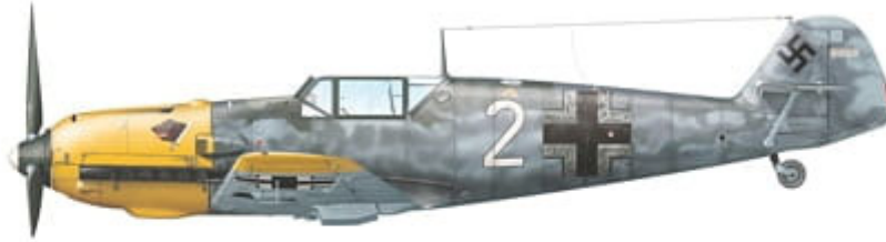
Messerschmitt Bf 109 E-7, 'White 2', flown by Lt. Heinrich Ehrler of 4./JG 5, Alakurtti, Finland, late April 1942.