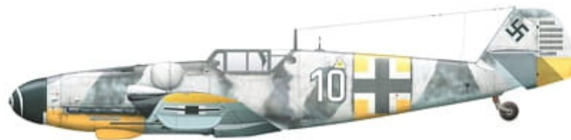
Messerschmitt Bf 109 G-6, 'White 10', flown by Oblt. Robert 'Bazi' Weiß, Kapitän of 10./JG 54, northern sector of the Eastern front, USSR, January 1944.

This set contains three high quality posters with colour profiles and decal placement guide, and waterslide decals printed by Cartograf.