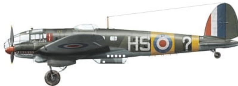
Heinkel He 111 H-6, coded 'HS-?' and named 'Delta Lily', No. 211 Group RAF, North Africa, December 1942.

This set contains three high quality posters with colour profiles and decal placement guide, and waterslide decals printed by Cartograf.