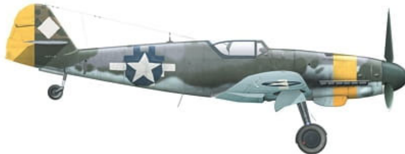
Messerschmitt Bf 109 K-4, coded 'Yellow 5', Salzburg-Maxglan, Austria, mid-1945.