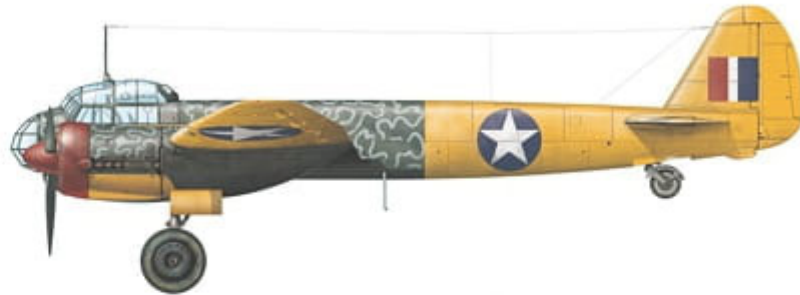
Junkers Ju 88 A-4, WNr. 300227, 86th FS / 79th FG, Foggia, Italy, autumn 1943.