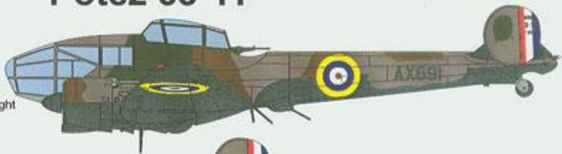
Potez 63-11 c/n 420 (AX 691), French Fighter Flight No.2, Haifa (Palestine), February 1941.