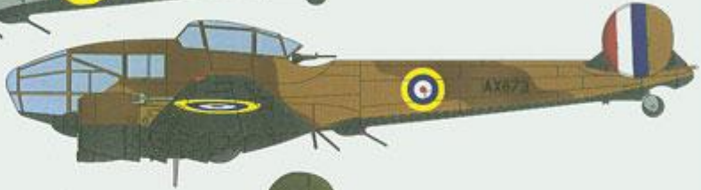
Potez 63-11 c/n670 (AX 673), French Fighter Flight No.2, Ismailia, Egypt, December 1940.