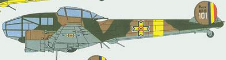
Potez 63-11, 101, Roumanian Air Force, 1942.