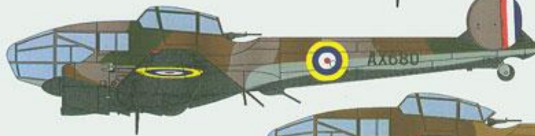
Potez 63-11 c/n 395 (AX 680), French Fighter Flight No.2, Haifa (Palestine), October 1940.