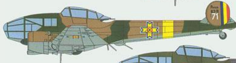
Potez 63-11, 71, Roumanian Air Force, 1942.