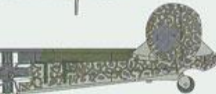
Hungarian Potez 63-11 ,KH+TF in German marking, Aviation Research Institute, Ferihegy airfield, spring 1944.