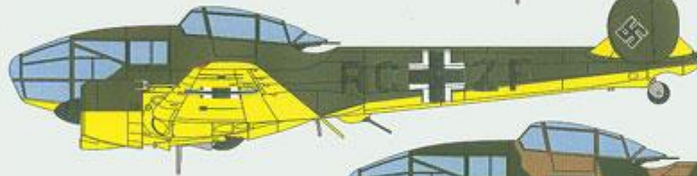
Potez 63-11, RC+ZF.