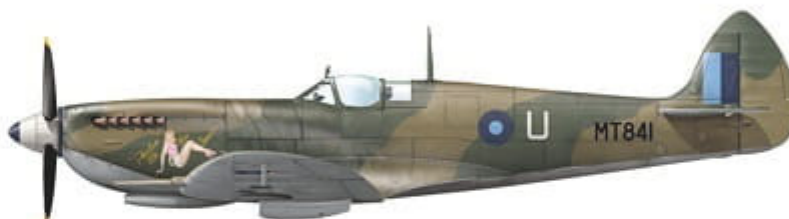
Supermarine Spitfire LF Mk.VIII (MT841), coded U of No. 2 Sqn RIAF, Kohat, British India, spring 1946.