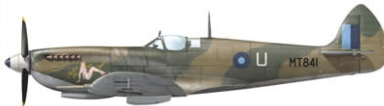
Supermarine Spitfire LF Mk.VIII (MT841), coded U of No. 2 Sqn RIAF, Kohat, British India, spring 1946.