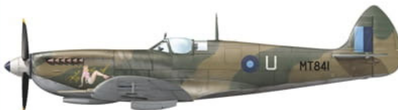
Supermarine Spitfire LF Mk.VIII (MT841), coded U of No. 2 Sqn RIAF, Kohat, British India, spring 1946.