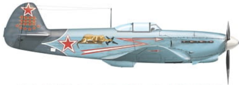
Yakovlev Yak-1b, flown by Capt. Vladimir P. Pokrovskiy of 2nd GIAP / 6th IAD, Air Force of the Northern Fleet, probably late 1943.