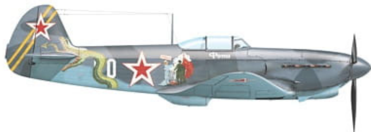
Yakovlev Yak-1b, most likely coded 'White 20', flown by Snr. Lt. Fotiy Y. Morozov of 31st GIAP / 6th GIAD, 4th Ukrainian Front, first half of 1944.

This set contains three high quality posters with colour profiles and decal placement guide, and waterslide decals printed by Cartograf.