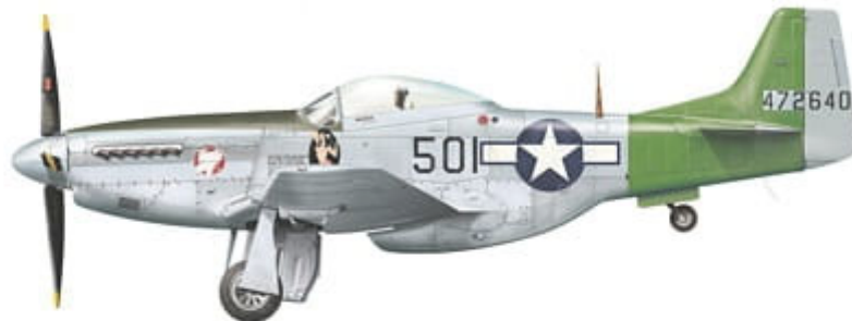
P-51D-25-NA, s/n 44-72640, coded '501', flown by Capt. Evelyn Neff of 457th FS / 506th FG, Iwo Jima, late spring / summer 1945.