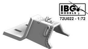
Fw 190D Instrument Panel Cover 3d Printed set for the whole IBG Models Fw 190D family