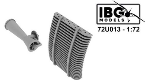
PZL P.11 Radiator and Venturi Tube 3d Printed set for all the IBG Models PZL P.11a, P.11b and P.11c kits

Cena : 22,00 PLN Producent : IBG Models Dostępność : Jest Stan magazynowy : bardzo wysoki Średnia ocena : brak recenzji