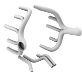
I.A.R.80/81 Exhausts 3d Printed set for the all IBG Models I.A.R. 80/81 kits