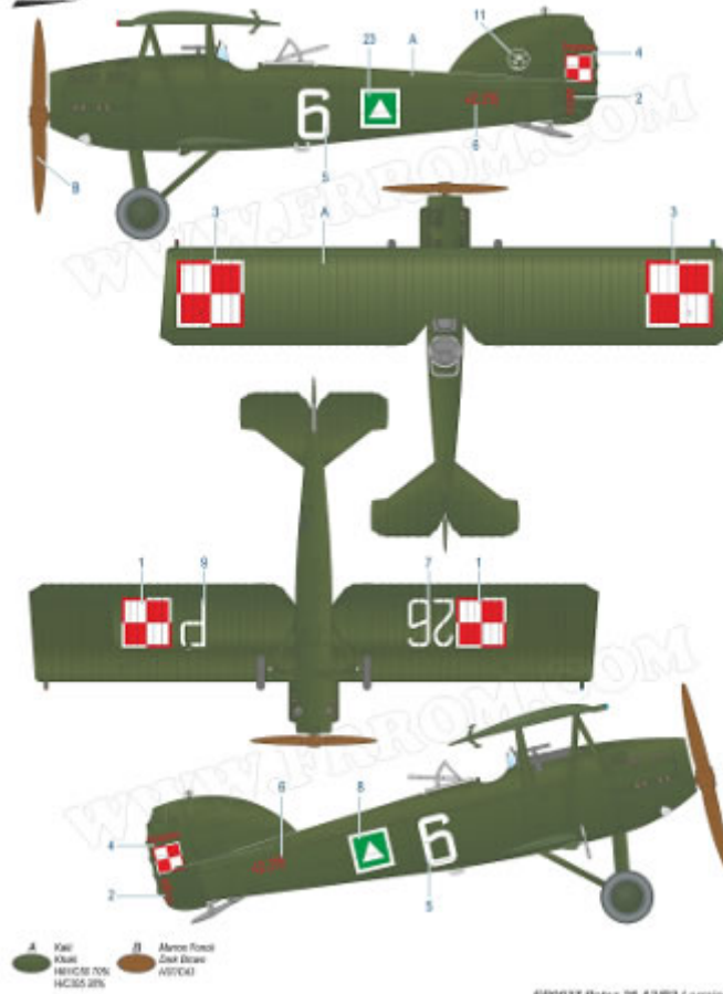
F10037 Potez 25 A2/B2 Lorraine